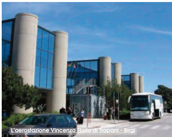
L'aerostazione Vincenzo Florio di Trapani - Birgi

Altro tema, non meno importante. Perché il governo regionale non promuove un gestore unico? Una volta riconosciuta l'esistenza di un problema sistemico, a livello nazionale, che ostacola lo sviluppo degli aeroporti periferici, e su cui la regione non può agire in maniera strategica ma soltanto con misure tattiche, qualche azione si può però iniziare ad implementare anche a livello regionale. Ad esempio Musumeci non molto tempo fa fece una affermazione, più che condivisibile. Affermò che, a suo avviso, sarebbe stato meglio avere una unica società di gestione aeroportuale regionale. Non quattro gestori quindi, e nemmeno due gestori, ma soltanto uno. Musumeci ha ragione. Il gestore unico ce l'hanno in Spagna, ce l'hanno quasi in Turchia, ce l'