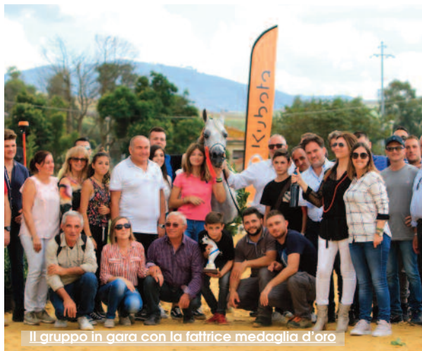
Il gruppo in gara con la fattrice medaglia d'oro

centro ippico Pietra dei Fiori a Buseto Palizzolo. Bellezza, potenza ed armonia sono stati i criteri di valutazione della giuria che ha selezionato gli esemplari migliori. «Sono molto soddisfatto - ha dichiarato l'organizzatore Antonio Culcasi -, sono stati due giorni di sana e sportiva competizione con esemplari molto belli ed un pubblico numeroso». La giuria ha valutato gli animali in base a dei parametri ben definiti: tipo, testa e collo, dorso e armonia, arti, movimento. Testa corta, collo arcuato, spalle e pastoriali ben inclinati sono alcuni dei tratti distintivi del cavallo arabo, noto anche per la sua forza e resistenza essendo stato utilizzato per secoli dalle tribù beduine nel deserto.