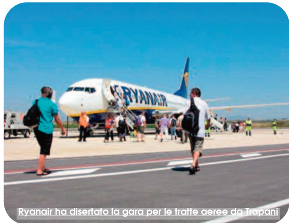
Ryanair ha disertato la gara per le tratte aeree da Trapani