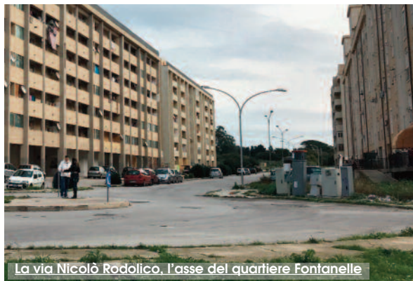
La via Nicolò Rodolico, l'asse del quartiere Fontanelle

«Le forze di polizia hanno colto il segnale di allarme che è giunto dal quartiere di Fontanelle sud, e non lo hanno sottovalutato». Il Prefetto di Trapani, Darco Pellos ha spiegato con queste parole l'intensa attività di controllo di Polizia, Carabinieri e Guardia di Finanza di spiegata nel quartiere popolare alla periferia del capoluogo, nel volgere di una settimana, sia nelle ore diurne che nelle ore notturne. È stata la risposta della presenza dello stato dopo i reiterati episodi di incendi di autoveicoli avvenuti nel quartiere o ai suoi margini. Oltre ai consueti e rafforzati pattugliamenti dinamici di polizia e carabinieri anche la guardia di finanza ha contribuito con pattuglie notturne. Inoltre