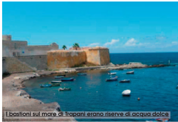
I bastioni sul mare di Trapani erano riserve di acqua dolce

La prima opera idrica in città infatti fu costruita solo nella prima metà del '300. L'acquedotto proveniva a Trapani su archi di pietra (lungo il tracciato che oggi si chiama appunto via Archi) e portava l'acqua in una fontana pubblica, la fontana di Saturno, ritenuto secondo una leggenda il fondatore di Trapani. Dopo varie vicissitudini, alla fine dell'800, per volere dell'onorevole Nunzio Nasi, fu costruito un nuovo acquedotto. L'attuale acquedotto fu realiz-