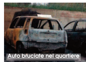
Auto bruciate nel quartiere

operazione ad "alto impatto" (così è stata anche chiamata) con un obiettivo primario, che non è la repressione dei reati, pure importante, ma «ristabilire la vicinanza dello Stato» ha sottolineato il Prefetto. «La grandissima parte delle persone che abitano nel quartiere sono oneste e laboriose - ha sottolineato il Prefetto - ma subiscono la presenza dei pochi soggetti che con le loro azioni fanno "più rumore". Abbiamo avvertito attraverso parole di incoraggiamento e precisi segnali che la presenza delle forze dell'ordine è stata ben gradita dalla parte buona. Intendiamo continuare a "presidiare" con una presenza costante il quartiere ed abbiamo anche avviato una interlocuzione con il